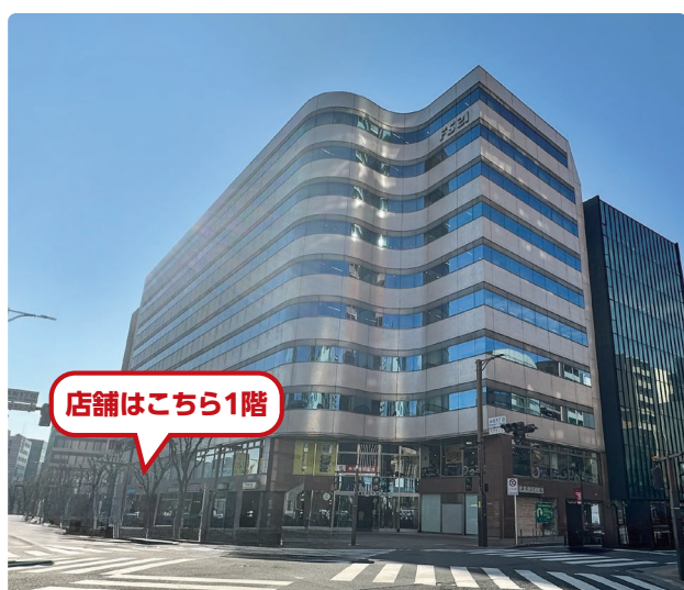
船橋スクエア21ビル 外観

※来店時に駐車券をご提示いただければ、手続きに要したお時間分のみ 無料サービス券をお渡しします。